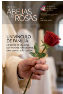
En la portada: creada con IA