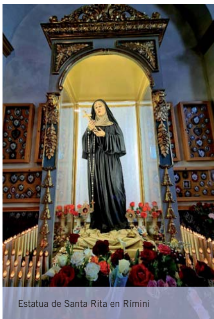
Estatua de Santa Rita en Rímíni