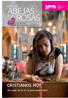
En la tapa: Cristianos hoy.

18 Las huellas de Rita Amiga de Cristo y de todos