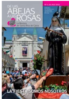
En la tapa: Devotos con la estatua de Santa Rita durante la fiesta del 22 de mayo de 2022 en Casia.