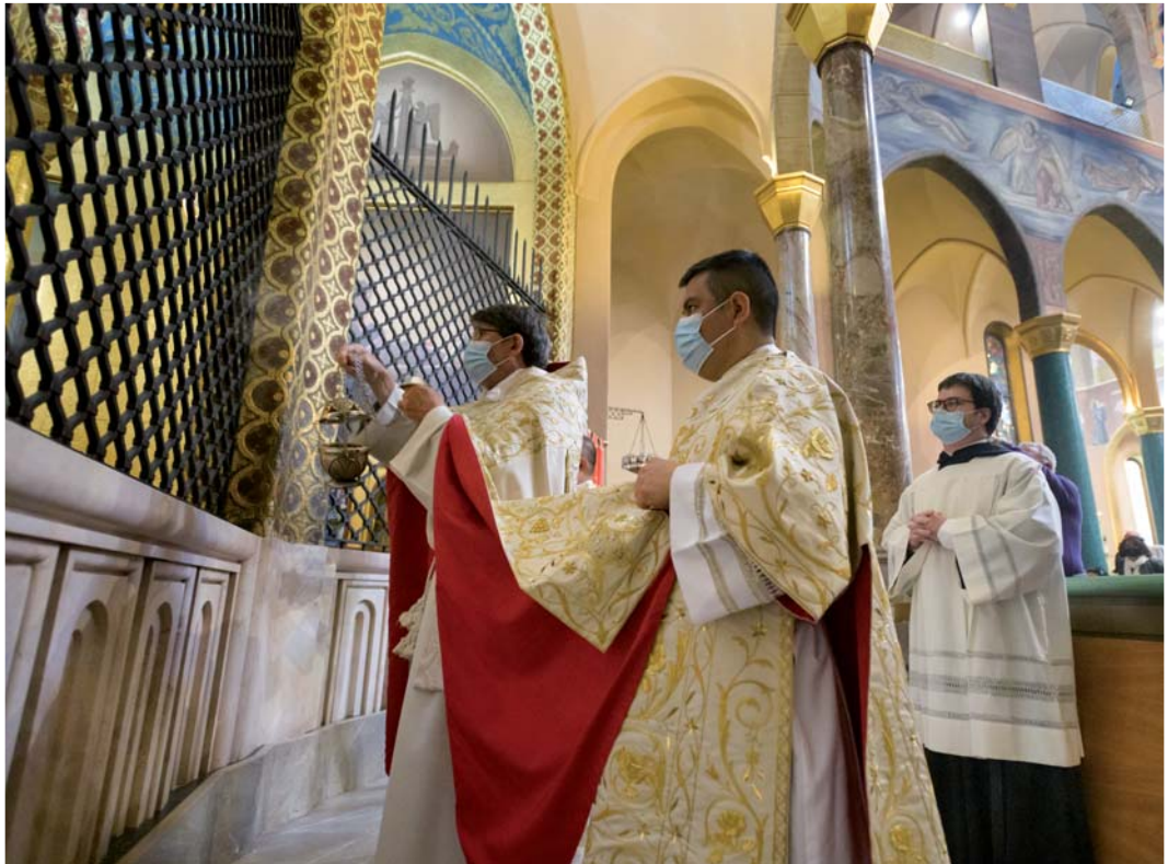
Uno de los momentos del Solemne Tránsito de Santa Rita del 21 de mayo

La presencia de Santa Rita se percibió tan fuerte como siempre