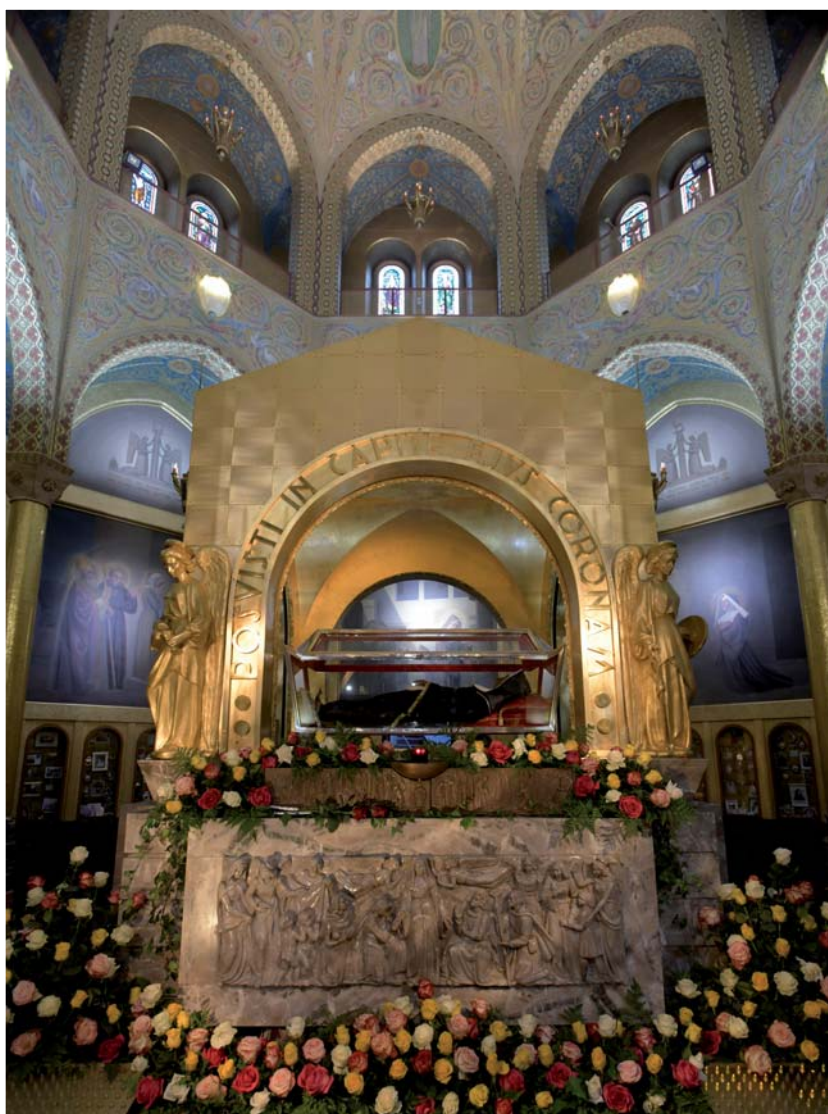
La urna de Santa Rita adornada para la fiesta con cientos de rosas de colores