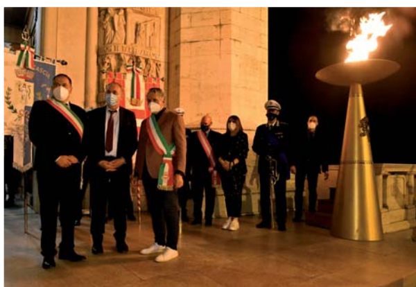
El encendido del Trípode Votivo en el sagrario de la Basílica dio inicio a las celebraciones

A través de los ejemplos de vida de Santa Rita y San Nicolás de Tolentino, dos son los temas que se han querido tocar en esta edición: la familia, estando en el año de la Familia Amoris Laetitia querida por el Papa Francisco y la sanación. Partiendo de estos temas, el camino marcado es el de Rita y Nicolás, que pasaron gran parte de su vida honrando a la familia, como la primera y