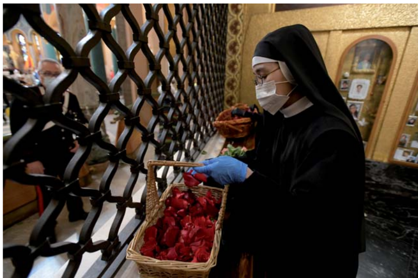
Las monjas en la Urna de Santa Rita entregaron miles de pétalos de rosa bendecidos

equipaje, hecho de tantas y tantas peticiones, acumuladas en este año y medio de dificultades y dolores enormes. Peticiones de sostén y protección, que no sólo eran personales, sino que respondían a situaciones sociales y de sufrimiento general. También vi la esperanza de quienes absorbieron cada momento y todas las emociones del tiempo transcurrido, en presencia o en vivo, en estos lugares para la ocasión. La de quienes, una vez terminada la fiesta, dejaron atrás cargas que creían imposibles de llevar, y mucho menos de sacarnos de encima, y en cambio encontraron un regalo fe-