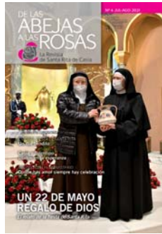
En la tapa: "Las dos Madres Superiores". (véase pág. 18-19)

23 Testimonios de Gracia Una herencia de amor