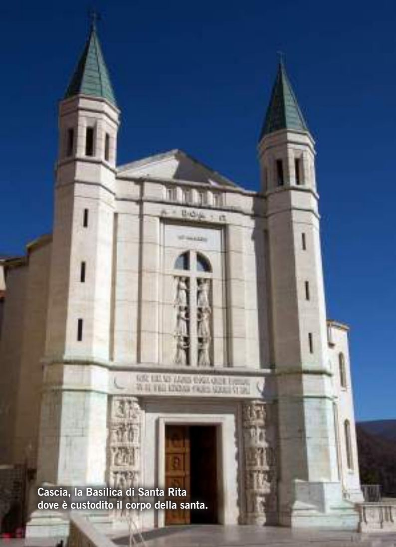
Cascia, la Basilica di Santa Rita dove è custodito il corpo della santa.