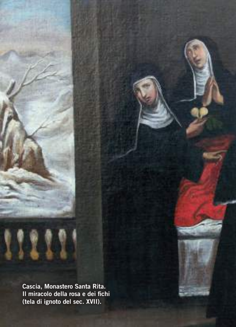
Cascia, Monastero Santa Rita. Il miracolo della rosa e dei fichi (tela di ignoto del sec. XVII).